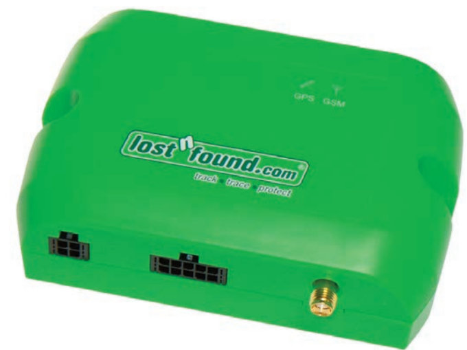
Das LOSTnFOUND LENTICUS Pro