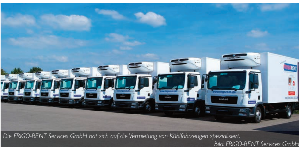
Die FRIGO-RENT Services GmbH hat sich auf die Vermietung von Kühlfahrzeugen spezialisiert.