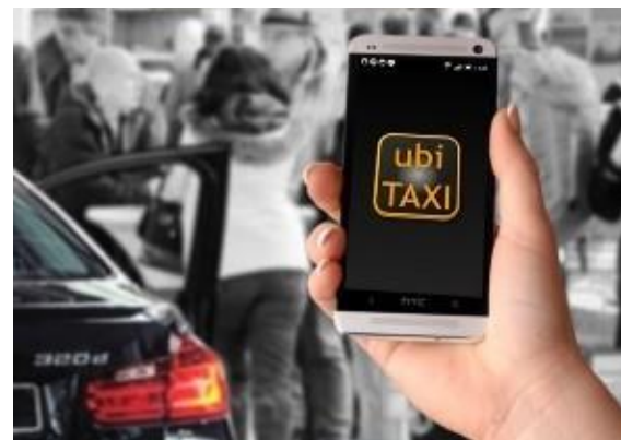
Der Fahrer empfängt die Auftragsdaten über die App auf seinem Smartphone oder Tablet.