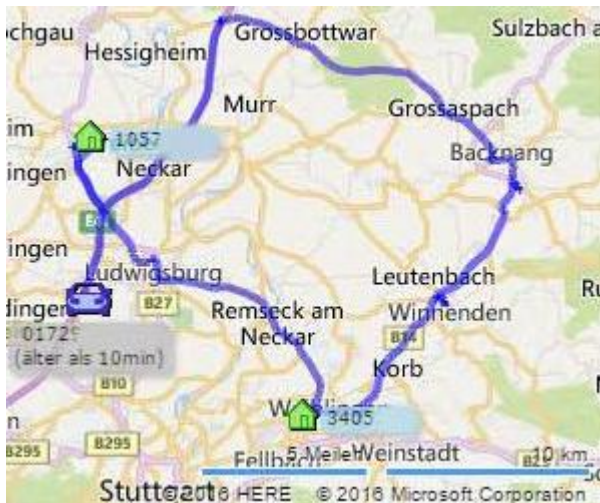
Auf der Karte

Die aktuelle Position ist immer im Blick, ebenso wie der Status der Auslieferung. Der nächste Mitarbeiter ist leicht zu finden, bei Zeitverzug kann der Fahrer schnell den Grund angeben.