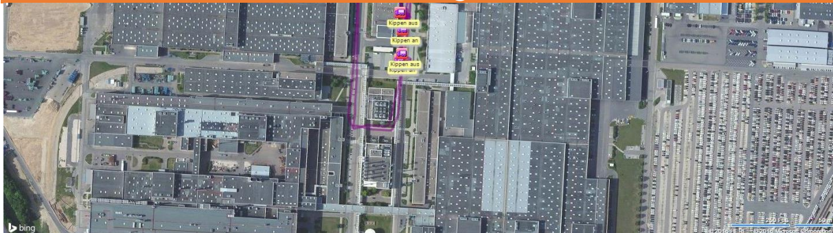
Kippen auf der Karte