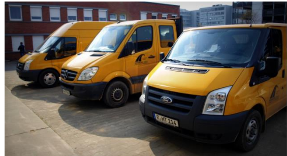
Immer wissen, wo Ihre Fahrzeuge sind!