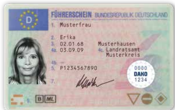
Führerschein mit RFID-Label

Mit der automatischen Führerscheinkontrolle ist eine persönliche Prüfung ab sofort nicht mehr nötig, so sparen Sie sich Zeit und Aufwand.