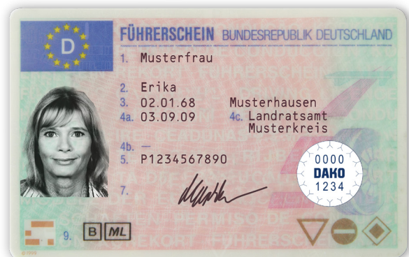
Führerschein mit RFID-Label

Mit der automatischen Führerscheinkontrolle ist eine persönliche Prüfung ab sofort nicht mehr nötig, so sparen Sie sich Zeit und Aufwand.