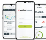
DIE Webfleet LOGBOOK- APP

i KPMG hat erfolgreich ein Audit von Webfleet Logbook durchgeführt, um die IT-Compliance zu überprüfen und einzuschätzen.