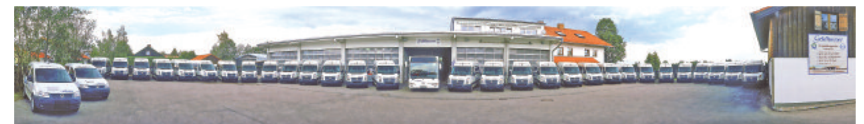
Geldhauser koordiniert eine Flotte von mehr als 200 Fahrzeugen – davon 120 Kleinbusse – zur Personenbeförderung.