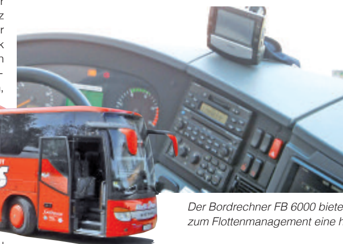
Der Bordrechner FB 6000 bietet dem Busfahrer neben Funktionen zum Flottenmanagement eine hochwertige Navigation an.